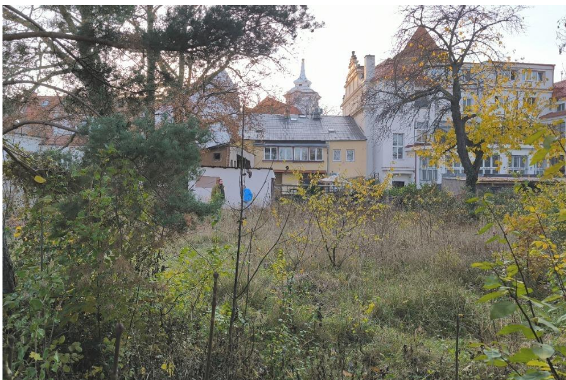
“Zahrada za zdí” za č.p. 24 - stav v listopadu 2025