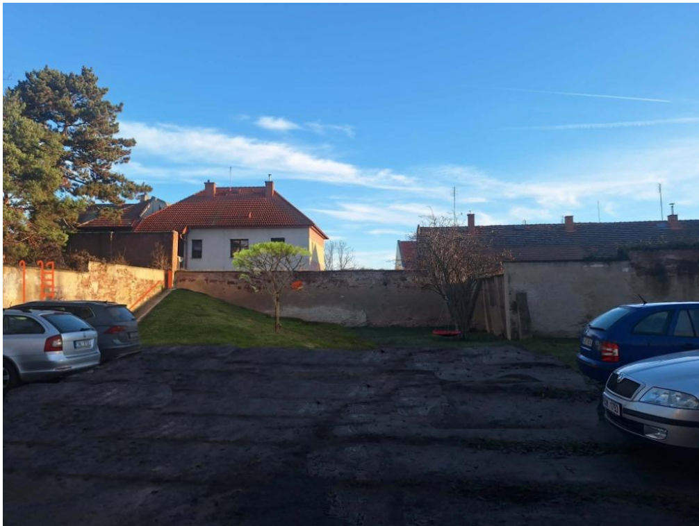
Vizualizace valu a herních prvků za č.p. 25, zpřístupnění zahrady