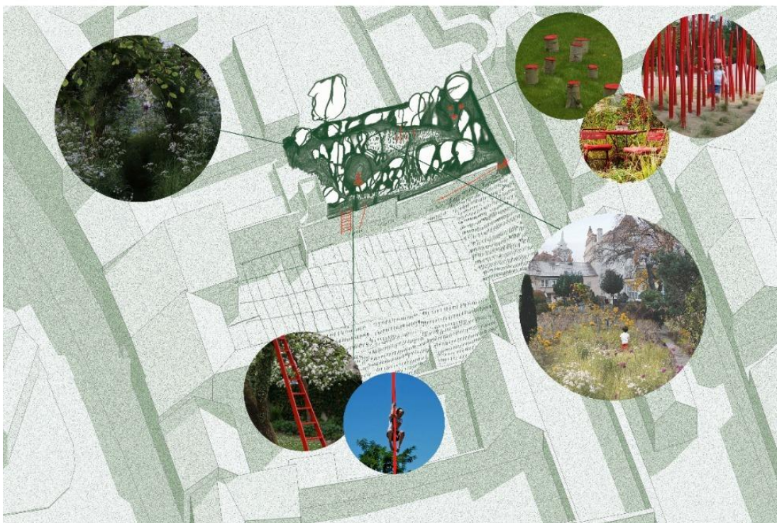
Vizualizace celé lokality "Zahrada za zdí" za č.p. 24 s návrhem koncepčního využití a možného umístění různých prvků v jednotící červené barvě.